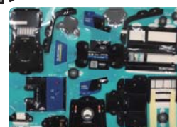
ベーパークラフト (住友ナコフォークリフト(株))