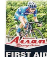
絆創膏 (愛三工業(株))