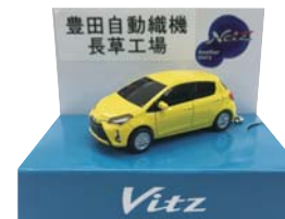
Vitz ミニカー (株) 豊田自動織機