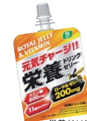
栄養ドリンク (株) スギ薬局