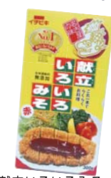
献立いろいろみそ (イチビキ(株))